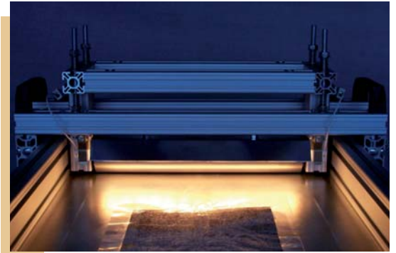
Laminiergerät - Labormodell