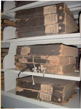
Historische, geschädigte Zeitungsbestände der Staatsbibliothek zu Berlin