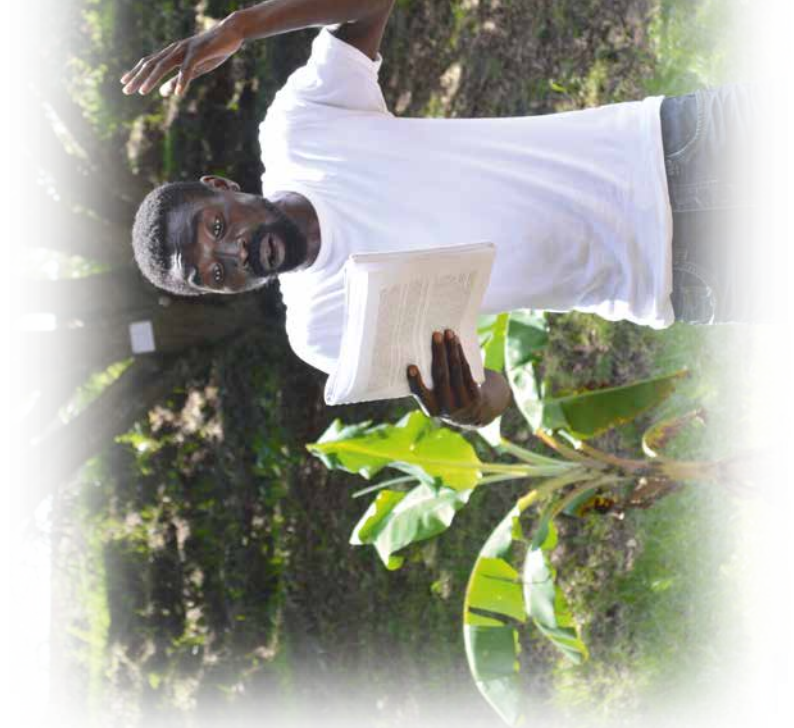
Boyzie Cekwana © Val Adamson Dieudonné Niangouna © Desire Kinzenguele